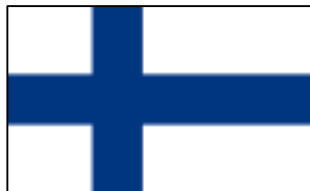
Drapeau de la Finlande

C'est un pays collé à la fois à la Suède et à la Norvège. Ce pays qui ne fait pas strictement partie de la Scandinavie est toutefois souvent rapproché de ses deux voisins. C'est un pays dont la superficie est de 340 000 km 2 (environ la moitié de la France) et la population d'un peu plus de 5,5 millions d'habitants (1/12 de la France).