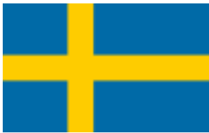
Drapeau de la Suède.

C'est aussi un pays de l'Europe du nord qui est collé à la Norvège. Sa capitale est Stockholm. La superficie est de 450 000 km 2 et dont la population est composée de presque 10 millions d'habitants. Pour comparer, la Suède est grande comme 2/3 de la France et sa population représente 1/6 de la France.