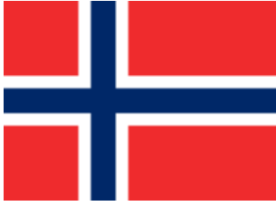
Drapeau de la Norvège.