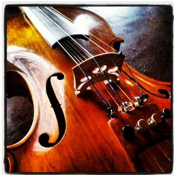
Violon Hardanger